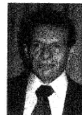
V.M. SAMAEI AUN WEOR